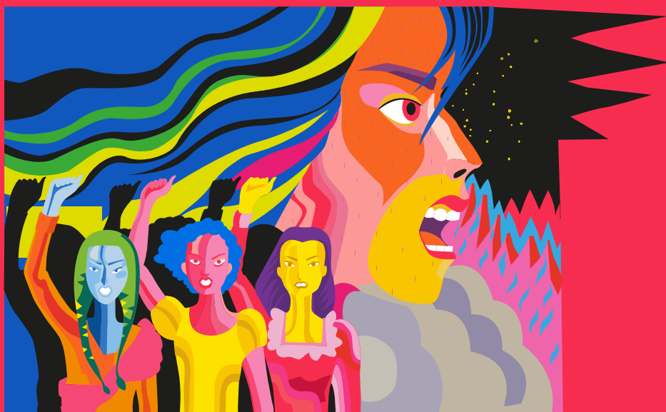
Imagen de portada: Ale Torres